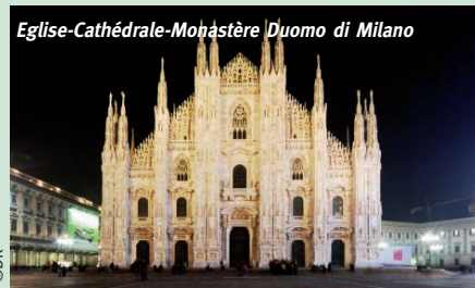
Eglise-Cathédrale-Monastère Duomo di Milano

Assistance légale dans plusieurs langues : Italien, Français, Anglais et Allemand.